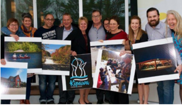
Le groupe de travail ayant réalisé le projet de Tourisme Kipawa.

mentor pour l'aider à développer les éléments clés (ex. mission, vision, valeurs, etc.) de leur stratégie conjointe. Elle les a aussi aidés à formuler les six objectifs stratégiques du projet.